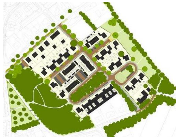
Stedenbouwkundig plan "De Boslaantjes"

In december 2018 lag het voorontwerp bestemmingsplan voor De Boslaantjes ter inzage. Op dit voorontwerp bestemmingsplan zijn geen reacties gekomen. Het bestemmingsplan De Boslaantjes gaat nu als ontwerp de vervolgpcedure in en komt in maart van dit jaar ter inzage. Iedereen heeft dan de mogelijkheid om zienswijzen in te dienen. Daarna wordt het bestemmingsplan De Boslaantjes naar verwachting in juni 2019 ter vaststelling voorgelegd aan de raad. Het plan 'De Boslaantjes' omvat circa 65 gevarieerde woningen die aansluiten bij de bestaande bebouwing en de dorpse sfeer van de wijk Waalre Noord.